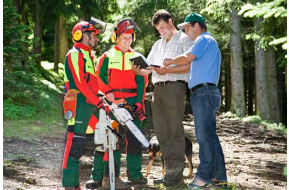
Mit den Profis vom Maschinenring auf der sicheren Seite.

Die Forstdienstleistungen werden in erster Linie von ortskundigen und kom-